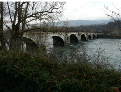
bleuté, un extrados : Pont Cuenot (XVIIe s.) sur l'Isère à Montmélian (côté aval)